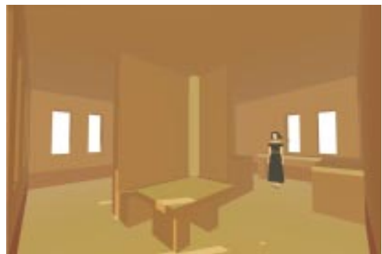
Wirtschaften – Aufhalten – Kochen

Das Gebäude ist nach westlichen Denken so etwas wie ein Wochenendhaus für 4 Personen. In Wirklichkeit werden sich drei Witwen mit zusammen 8 Kindern riesig freuen und wieder Hoffnung schöpfen. Wer auch immer so ein Gebäude bezieht wird vorher auch dazu beigetragen haben. Mit den ersten Bildern der Musterhäuser und dem Anblick dankbarer Menschen vor dem Haus erhalten wir neue Spenden.