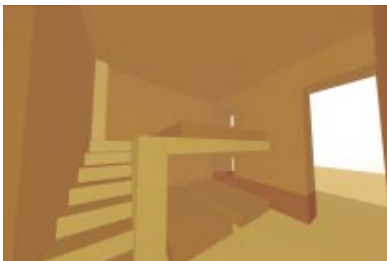
Schlafbereich in zwei Ebenen

Ein Bodenbelag sowie Fensterelemente oder Haustüren werden bei Übergabe noch nicht vorhanden sein um nicht die wertvolle Zeit vor dem nächsten Winter zu verlieren und weitere Gebäude fertig zu stellen.