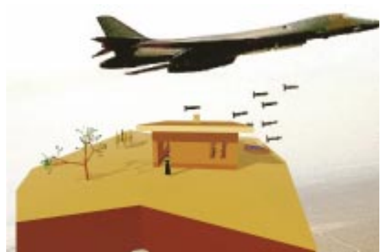
Aber noch ist nichts sicher ...

Ein Bodenbelag sowie Fensterelemente oder Haustüren werden bei Übergabe noch nicht vorhanden sein um nicht die wertvolle Zeit vor dem nächsten Winter zu verlieren und weitere Gebäude fertig zu stellen.