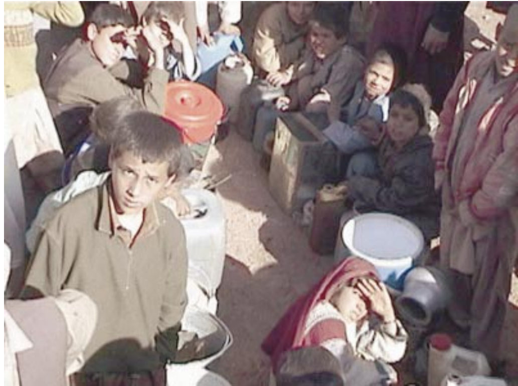
Wasserausgabe in einem Flüchtlingscamp