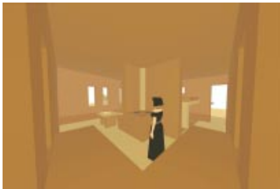
Aufhalten – Kochen - Schlafen