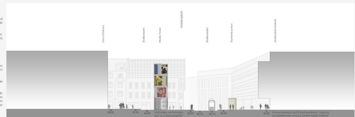
< LAGEPLAN 1:200 | SCHNITT 1:200 ^