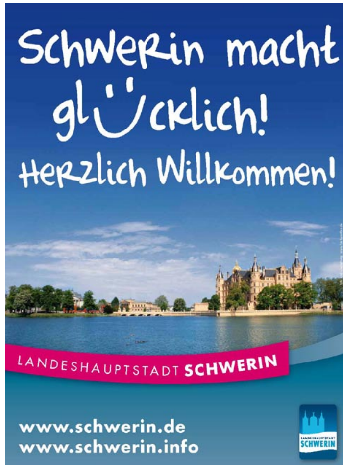
Mit diesen neuen Plakaten heißt Schwerin seine Gäste willkommen.