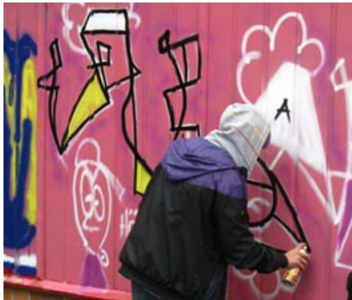
Jugendliche probieren sich im Spraying beim Workshop an der Fassade der Sporthalle in der Ziolkowski Straße.