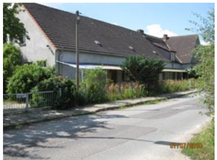
Steht zum Verkauf: das Grundstück Mittelstelle 9 in Görries.

Ein Verkauf des Grundstückes bedarf der Beschlussfassung durch das zuständige städtische Gremium der Landeshauptstadt Schwerin. Die Landeshauptstadt Schwerin behält sich vor, von einem Verkauf des Grundstückes abzusehen, zu Nachgeboten aufzufordern oder das Grundstück erneut anzubieten. Dieses und weitere Grundstücksangebote der Landeshauptstadt Schwerin finden Sie auch unter www.schwerin.de/immobilien .